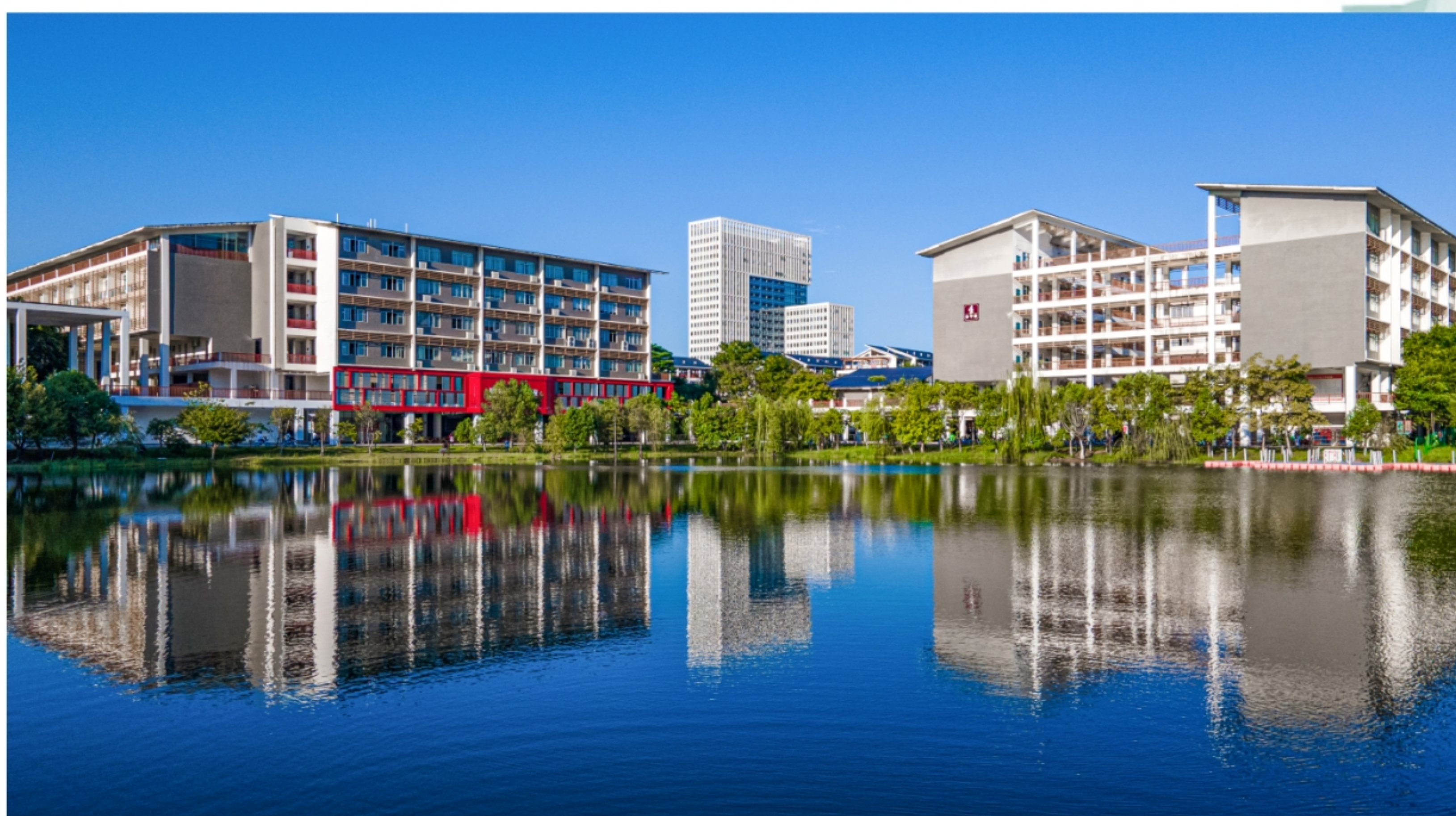
南宁职业技术大学金葵湖